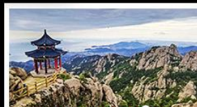
ภูเขาเลาซาน