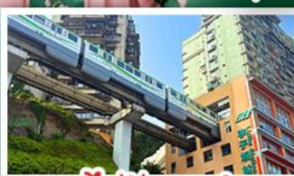
รถไฟฟ้าทะลุคัง