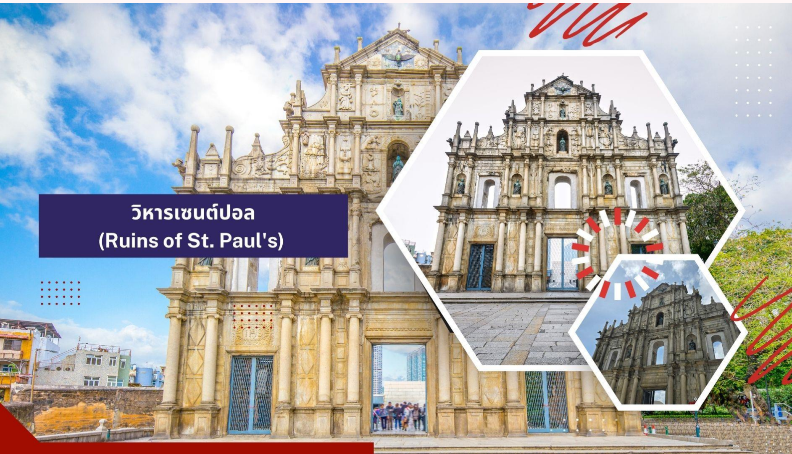
วิหารเซนต์ปอล (Ruins of St. Paul's)

นำท่านเดินทางสู่ นำท่านเดินทางสู่ มาเก๊า (ในการเดินทางข้ามด่าน ท่านจะต้องลากกระเป๋าสัมภาระของท่านเอง และผ่านพิธีการตรวจคนเข้าเมืองใช้เวลาในการเดินประมาณ 45-60 นาที) ในอดีตมาเก๊าเป็นเพียงแค่หมู่บ้านเกษตรกรรมและประมงเล็กๆ ซึ่งเป็นเมืองที่มีประวัติศาสตร์ยาวนาน โดยมีชาวจีนกวางตุ้งและฟูเจี้ยนเป็นชนชาติดั้งเดิม จนมาถึงช่วงต้นศตวรรษที่ 16 ชาวโปรตุเกสได้เดินเรือเข้ามายังคาบสมุทรแถบนี้เพื่อติดต่อค้าขายกับชาวจีนและมาสร้างอาณานิคมอยู่ในแถบนี้ ที่สำคัญ คือ ชาวโปรตุเกสได้นำพาเอาความเจริญรุ่งเรืองทางด้านสถาปัตยกรรมและศิลปวัฒนธรรมของชาติตะวันตกเข้ามาอย่างมากมาย ทำให้มาเก๊ากลายเป็นเมืองที่มีการผสมผสานระหว่างวัฒนธรรมตะวันออกและตะวันตกอย่างลงตัว