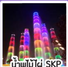
น้ำพุไม้ไผ่ SKP