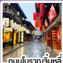
ถนนโบราณจีนหลี

เดินทาง 17-21 ธ.ค. 68 18-22 ธ.ค. 68 19-23 ธ.ค. 68